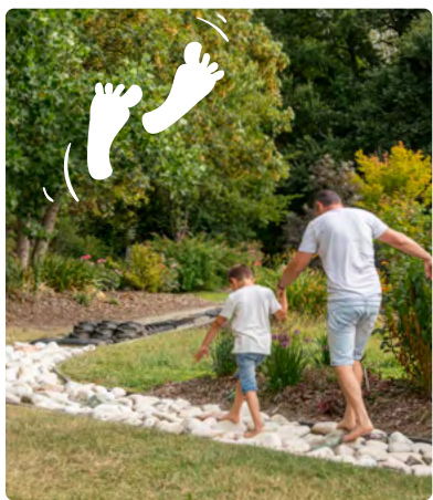
Réveille tes pieds: le toucher autrement...

des aventures pour réveiller vos 5 sens !