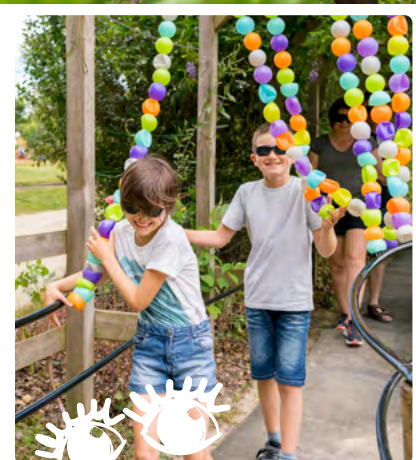
Active tes sens: Cap' de marcher sans la vue ?